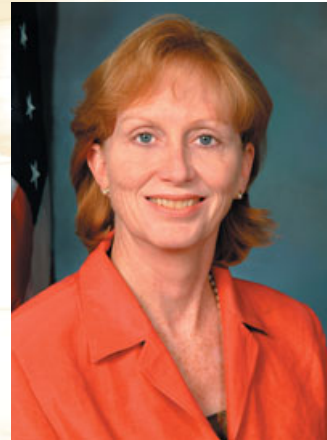
Телма Дж. Аскей Директор Агентство США по торговле и развитию

Агентство по торговле и развитию США (USTDA) помогает спонсорам проектов в развивающихся странах и в странах со средним уровнем дохода получить доступ к накопленному в США опыту в сфере планирования и реализации приоритетных проектов развития инфраструктуры, а также связанной с этим деятельности по наращиванию ресурсов. Мы стремимся определить проекты, способствующие экономическому развитию, и отдаем предпочтение американской продукции, технологиям и услугам во время осуществления проектов.